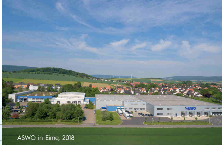
ASWO in Eime, 2018

Starten Sie mit uns erfolgreich in Ihre Zukunft