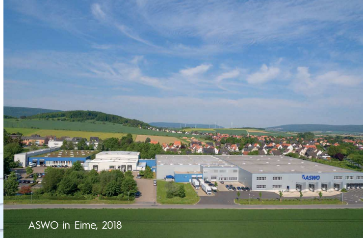
ASWO in Eime, 2018

Starten Sie mit uns erfolgreich in Ihre Zukunft